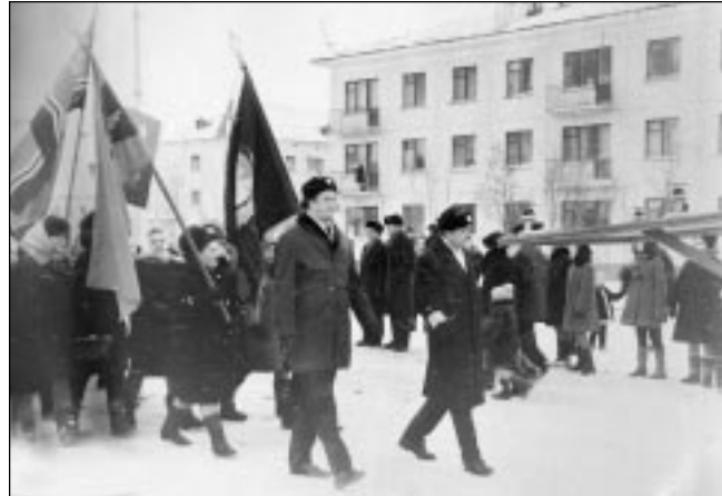
На снимках из семейного альбома: аэропорт Воркута; демонстрация в Воркуте; зима в Воркуте; на Дне шахтера.