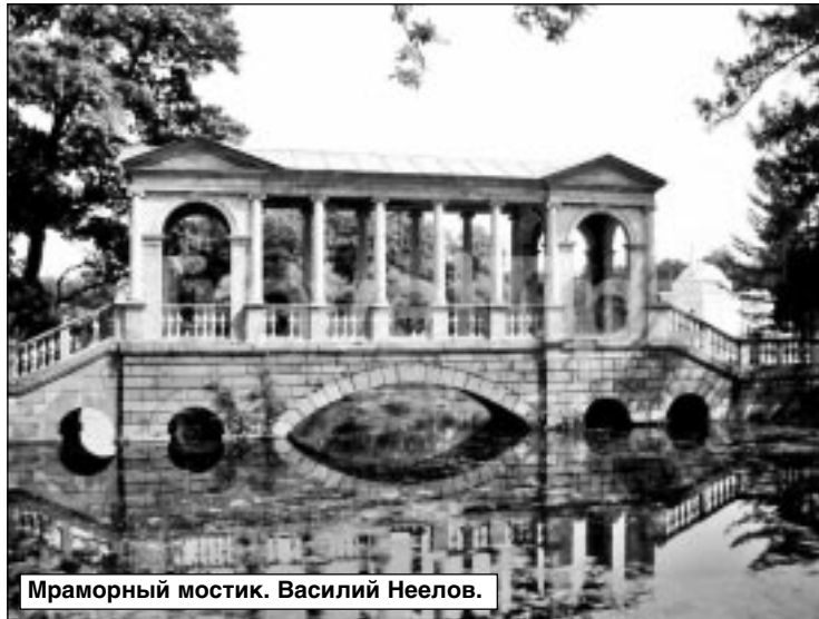
Мраморный мостик. Василий Неелов.