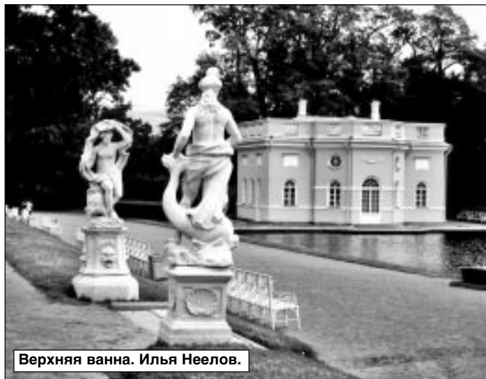
Верхняя ванна. Илья Неелов.