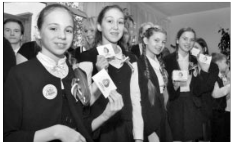
XXI века», выдвинула проект развития медиасети на конкурс социально-образовательных проектов «Росмолодежь», таким образом вытравив билет в первые ряды участников РДШ.