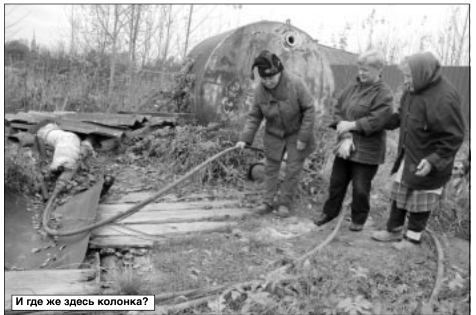
И где же здесь колонка?

– Беру, как и многие, грязную воду из скважины. А что делать, если сейчас я одна и сама не могу за ней съездить? Кто принесет мне воды? Нужно готовить, стирать, убирать, – сетовала пожилая женщина, поглаживая сидящую у ног небольшую желто-коричневого окраса, редкой для деревни породы эрдельтерьер, которую она называла Дусей . Как выяснилось, это была вовсе не Дуся , а Дульсинья , оставленная бабушке городскими внуками на лето, да так и заглотившая здесь до осенних холодов.