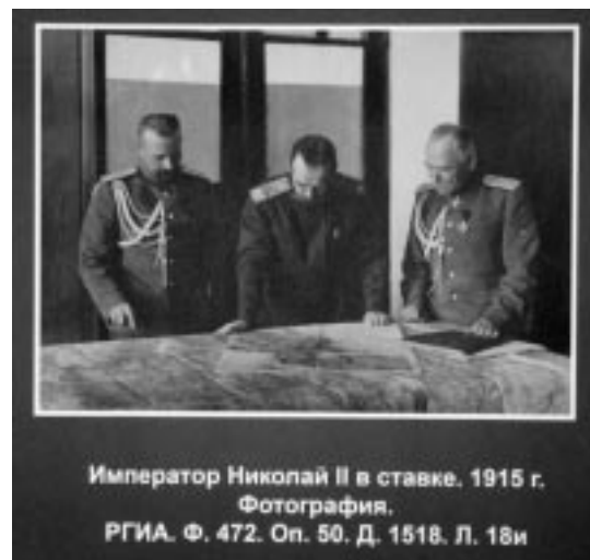
Император Николай II в ставке. 1915 г. Фотография. РГИА. Ф. 472. Оп. 50. Д. 1518. Л. 18и

Со многих фотографий на нас смотрят простые люди: крестьяне, извозчики, молочницы, пожарные, сестры милосердия и разносчики газет. Булла одинаково усердно фиксировал все стороны жизни сто-