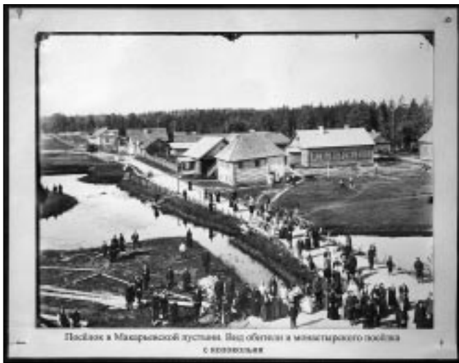
Посёлок в Макарьевской пустыни. Вид обители и монастырского посёлка с колокольни