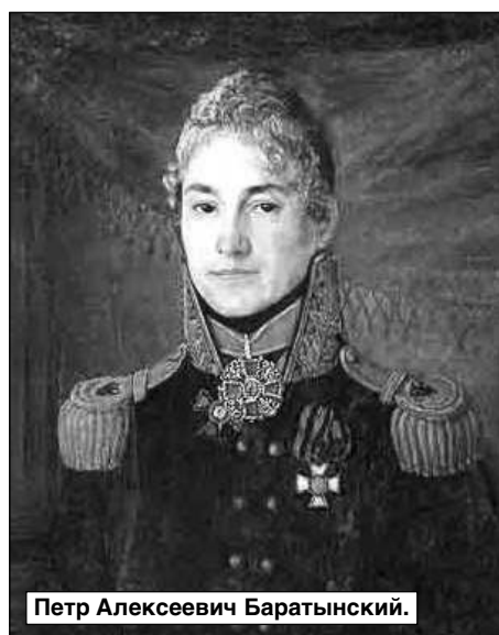
Петр Алексеевич Баратынский.

Во время Отечественной войны 1812 г. Баратынский был отправлен со своим морским корпусом и с корабельным училищем в Свеаборг. Это была бывшая шведская крепость, находившаяся в трех километрах от Гельсингфорса (Хельсинки). В 1813 году Баратынский командовал возвращением корпуса и училища в Пе-