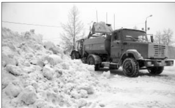
СНЕГУ НАМЕЛО.

Определенные главами администраций ответственные за пресечение несанкционированной торговли специалисты совместно с представителями государственной ветеринарной службы должны постоянно контролировать обстановку по данному вопросу на вверенной территории.