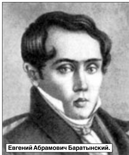
Евгений Абрамович Баратынский.