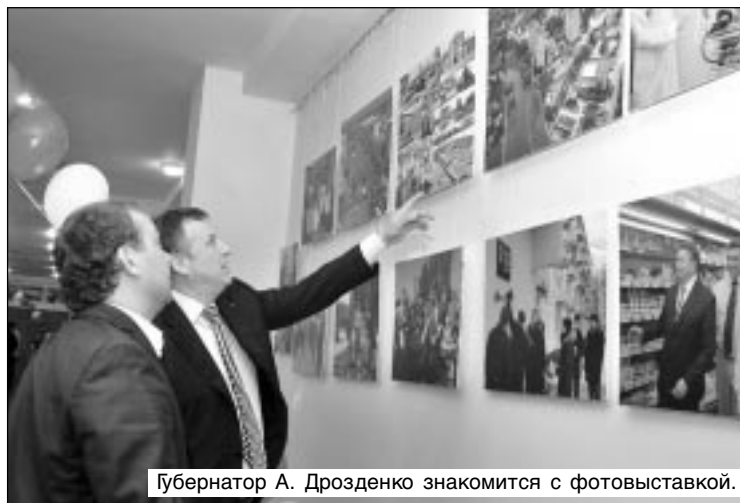
Губернатор А. Дрозденко знакомится с фотовыставкой.