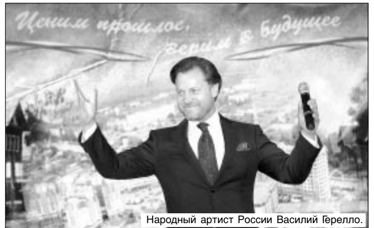
Народный артист России Василий Герелло.

тов Законодательного собрания, гостей праздника – начались награждения. В этот день многие тосненцы, работающие в различных сферах городской инфраструктуры, получили подарки, грамоты и цветы. Но главным подарком для всех стали песни в исполнении Ва-