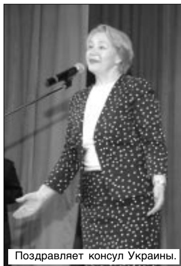
Поздравляет консул Украины.