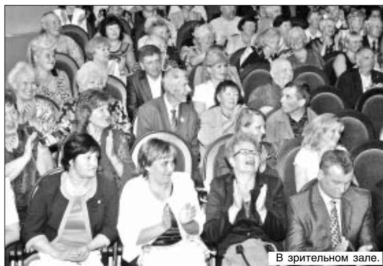
В зрительном зале.