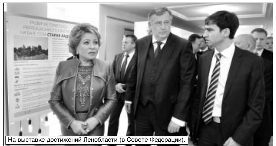
На выставке достижений Ленобласти (в Совете Федерации).

С самого начала своей работы на посту губернатора Александр Дрозденко уделял пристальное внимание реформе местного самоуправления. Муниципальная власть должна стать эффективным инструментом, регулирующим жизнь в городах и селах региона – такова цель предпринимаемых изменений. Большое внимание