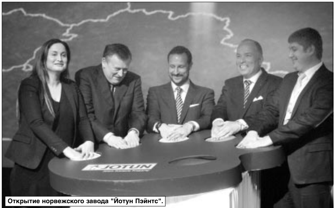
Открытие норвежского завода "Йотун Пэйнтс".