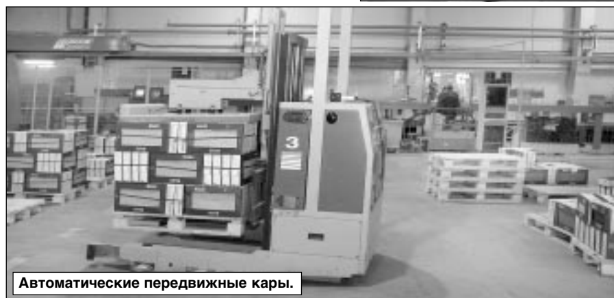
Автоматические передвижные кары.