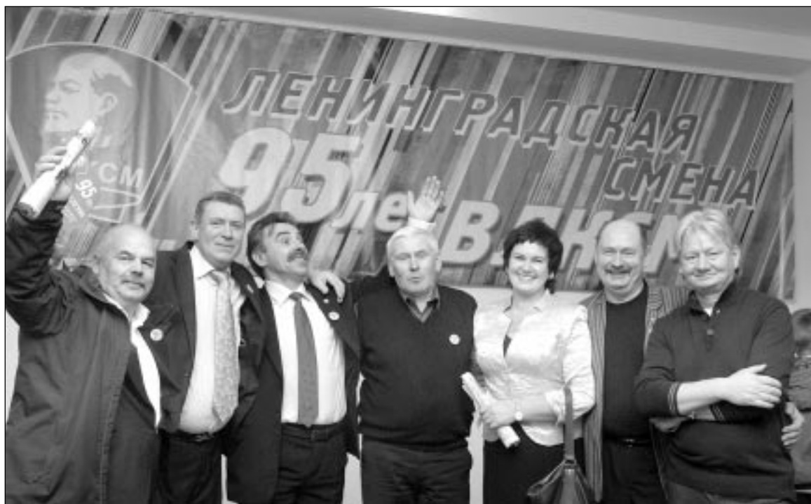
В канун 95-летия со дня образования Всесоюзного ленинского коммунистического союза молодежи (ВЛКСМ) в городе Тосно прошло торжественное собрание – на сцене районного Дворца культуры чествовали ветеранов комсомола Ленинградской области. На торжество по случаю юбилейной даты приехал и губернатор Ленинградской области Александр Дрозденко.