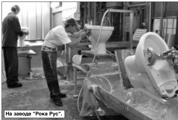
На заводе "Рока Рус".