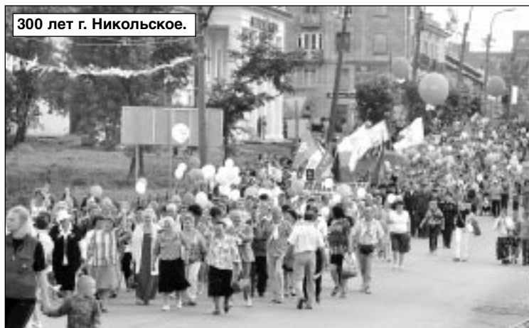
300 лет г. Никольское.