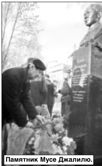
Памятник Мусе Джалилю.