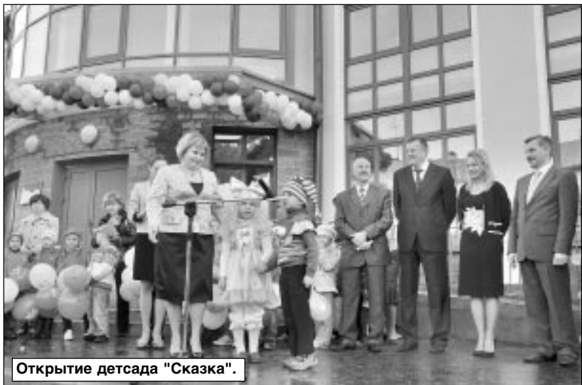
Открытие детсада "Сказка".