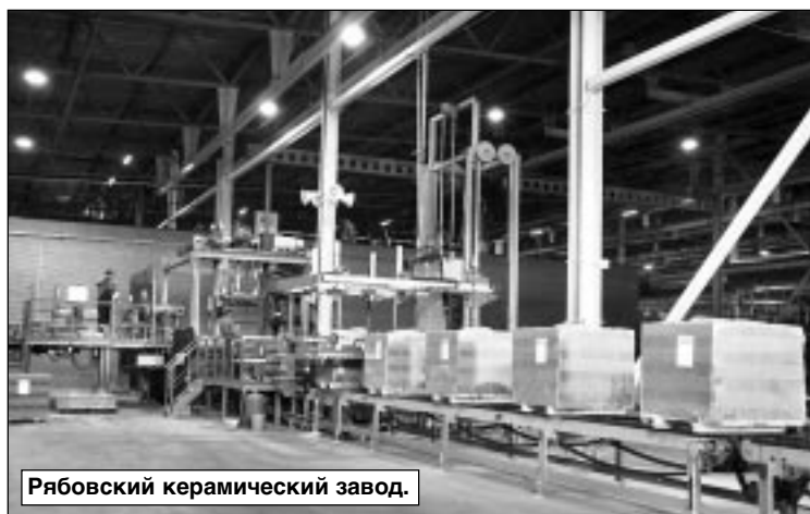
Рябовский керамический завод.