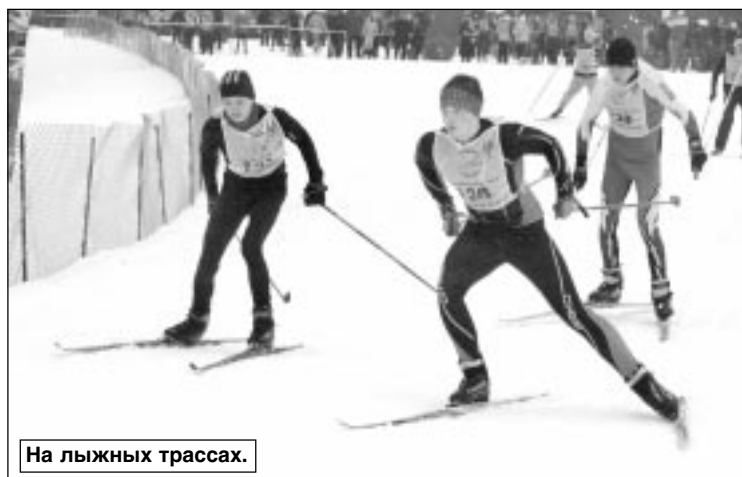
На лыжных трассах.