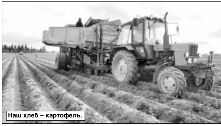
Наш хлеб – картофель.