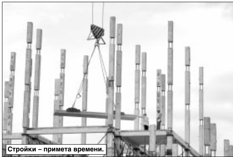
Стройки – примета времени.