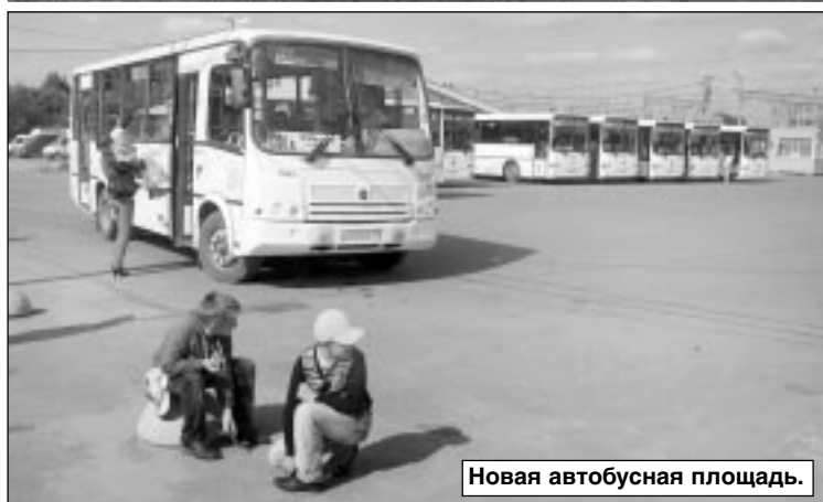
Новая автобусная площадь.