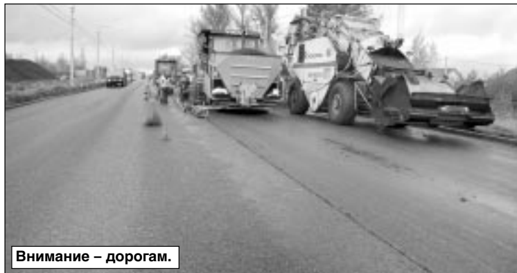
Внимание – дорогам.