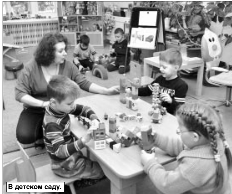
В детском саду.