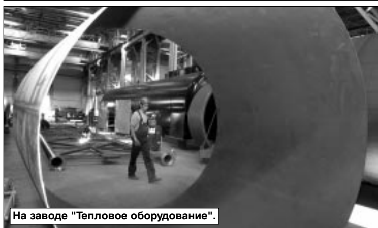
На заводе "Тепловое оборудование".