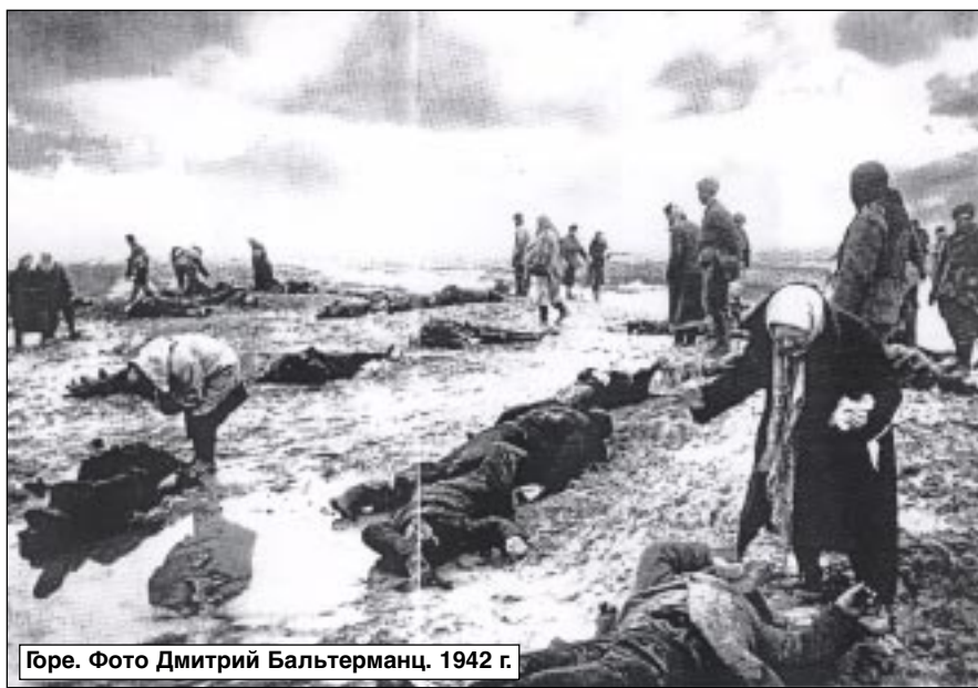
Горе. 1942 г.