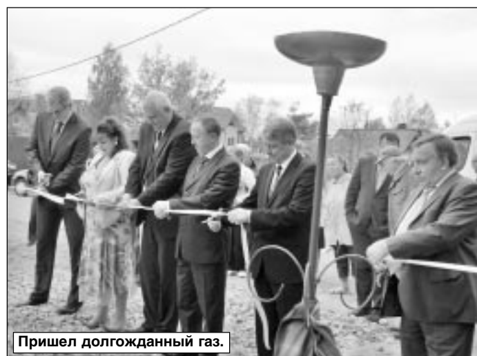
Пришел долгожданный газ.

ваниям проектировщиков. Но я думаю, что этот вопрос мы все-таки решим.