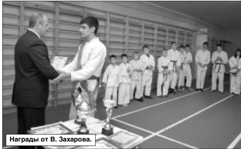
Награды от В. Захарова.