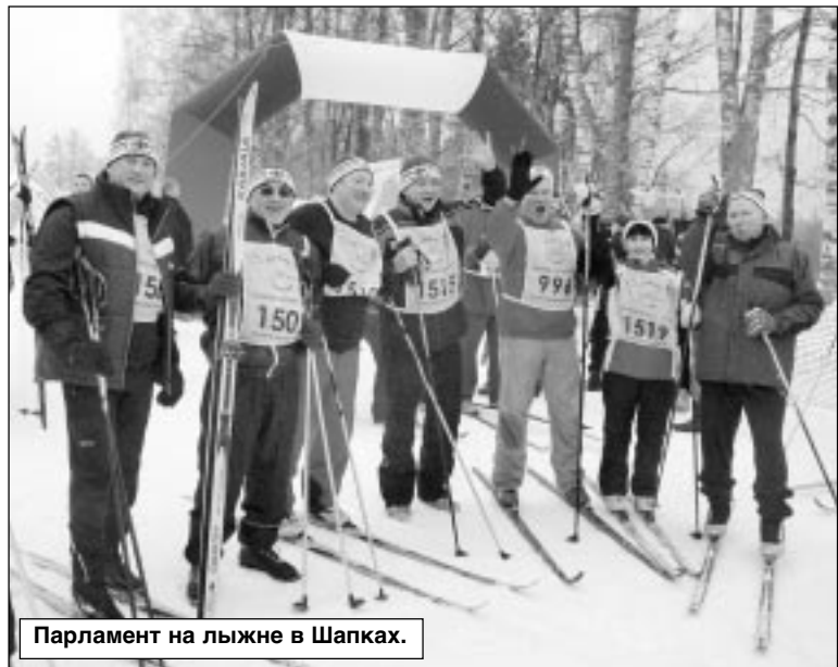
Парламент на лыжне в Шапках.

С 2007 года Законодательное собрание проводит ежегодный конкурс на лучшую организацию работы представительных органов местного самоуправления Ленинградской области и конкурсы областных электронных и печатных СМИ "Эффективное сотрудничество" и "Дела и лица".