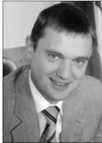
Кирилл ПОЛЯКОВ, председатель Законодательного собрания с 2003 по 2007 год:

"Эти годы для Законодательного собрания Ленинградской области были периодом его утверждения на международной арене, усиления его влияния и значимости на региональном поле, в межпарламентской деятельности".