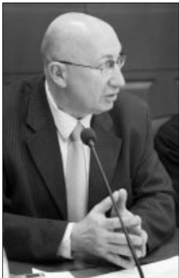
Виталий КЛИМОВ, председатель Законодательного собрания с 1997 по 2003 год:

"На плечи депутатов второго созыва легла трудная и ответственная миссия: было положено начало созданию экономической основы развития Ленинградской области. И с полной уверенностью можно сказать, что разработка и подготовка серьезной экономической базы, обеспечившей в дальнейшем прорыв Ленинградской области в экономическом и социальном развитии, – это бесспорная заслуга депутатов второго созыва".