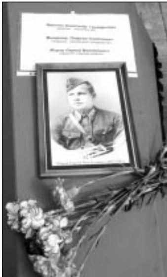
ее, укрепить на транспаранте и принять участие в митинге.