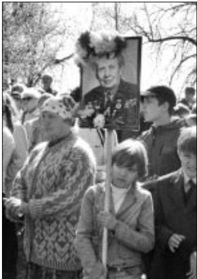
в семейном альбоме фотографии родственника, ветерана ВОВ, напечатать

Для участия в акции любой человек может найти