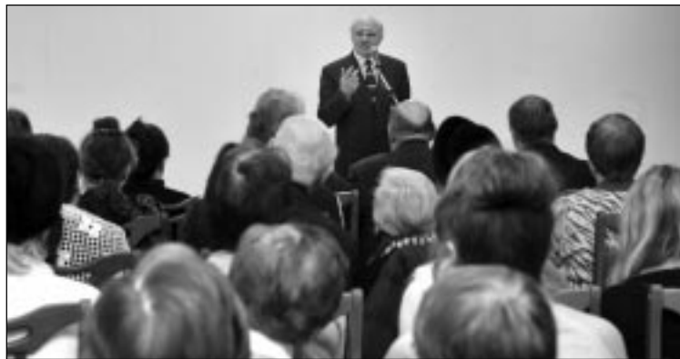
Агитационный материал оплачен из средств избирательного фонда Регионального отделения Политической партии Справедливая Россия в Ленинградской области.