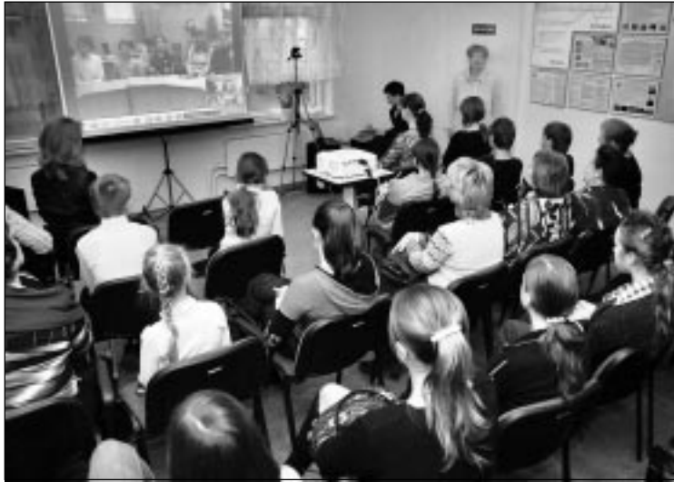
Основной темой состоявшейся в этом году педагогической конференции стала модернизация образования.