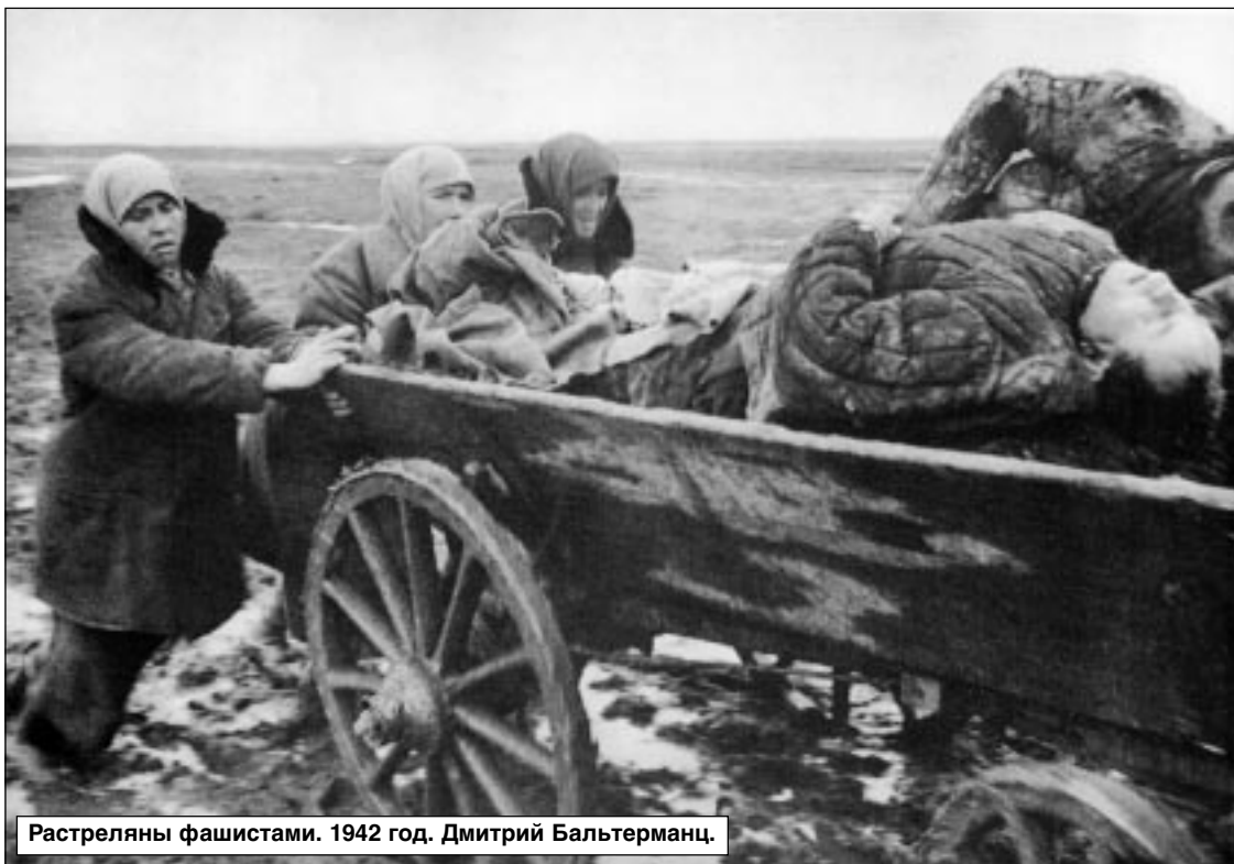
Расстреляны фашистами. 1942 год.

Я – дочь фронтовика. Мой отец прошел всю войну от первого до последнего дня, закончив ее в Вене. Не раз был ранен,