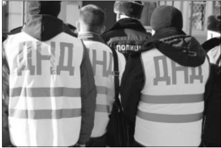
Начало на 3-й стр.

● В дружину не принимаются лица, страдающие психическими расстройствами, больные наркоманией или алкоголизмом, а также граждане, которые неоднократно в течение года, предшествовавшего дню принятия в Тосненскую ДНД, подвергались в судебном порядке административному наказанию за совершенные административные правонарушения. Не могут стать членами ДНД и лица, имеющие гражданство