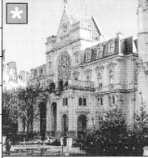
Музей в Париже

Извещение о проведении собрания о согласовании местоположения границы земельного участка ООО "Бодрунов", 187000, г. Тосно, пр. Ленина, д. 60, 3 этаж, оф. 10, Лицензия ФСГ и К РФ, рег. № СЗГ01958Г от 27.04.07 г. Выполняются кадастровые работы по уточнению местоположения границы земельного участка, расположенного по адресу: Ленинградская обл., Тосненский р-н, ГП Ульяновка, Советский пр., д. 88. Заказчиком работ является его правообладатель. Собрание заинтересованных лиц по поводу согласования местоположения границы состоится в офисе ООО "Бодрунов" 29 ноября 2011 г. в 11 часов 00 минут. Ознакомиться с проектом плана земельного участка, делать заявления можно ежедневно, кроме выходных, с 9.00 до 16.00 в офисе ООО "БОДРУНОВ". Смежные земельные участки, с правообладателями которых требуется согласовать границы: Ленинградская обл., Тосненский р-н, ГП Ульяновка, Советский пр., д. 86. При проведении согласования границ при себе необходимо иметь документ, удостоверяющий личность, а также документы о правах на земельный участок.