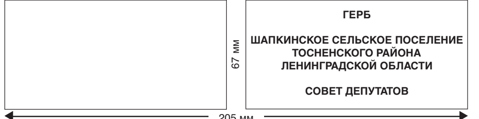
№ 1. Образец внутреннего разворота удостоверения депутата

Образец лицевого разворота удостоверения.