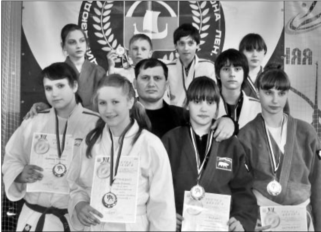
Воспитанники Тосненской спортшколы по дзюдо снова и снова доказывают свою состоятельность на соревнованиях различного уровня.