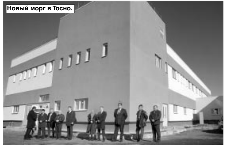
Новый морг в Тосно.

Жители Любани, например, считают, что их город – это Богом забытый уголок.