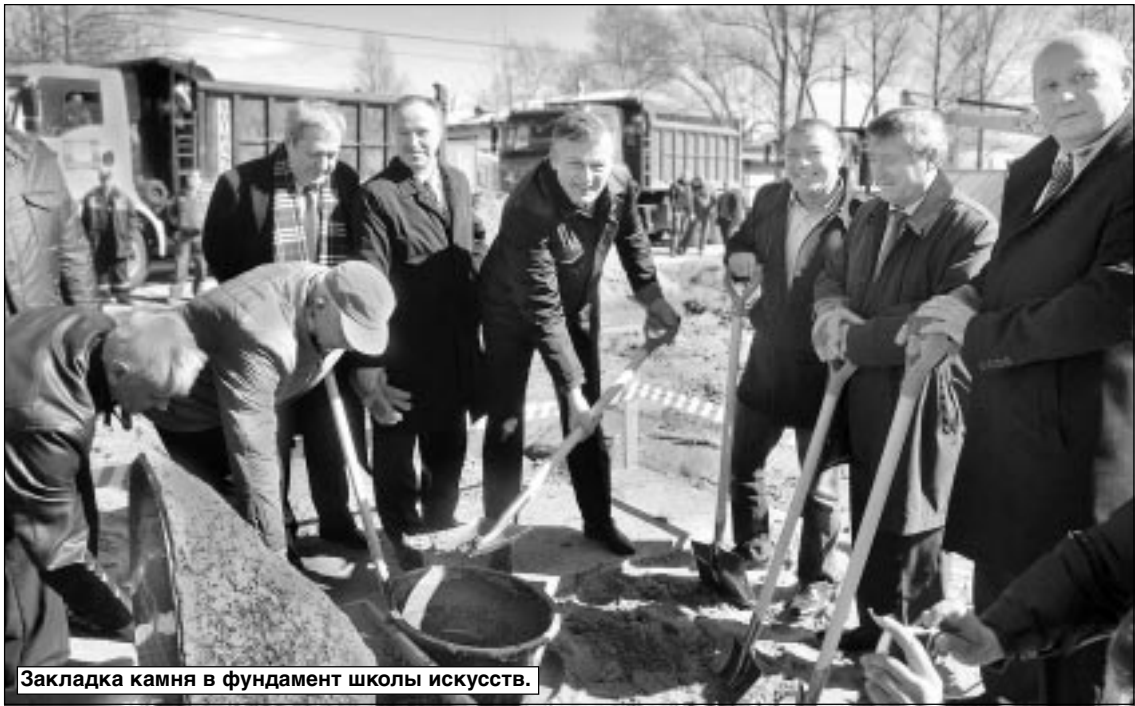
Закладка камня в фундамент школы искусств.

– Главное, нашим женщинам теперь не нужно ездить в областную больницу по всякому поводу, – сказала ожидавшая приема врача будущая мама. – Мы теперь можем лечиться у себя дома. Хочу сказать, что врачи у нас всегда были внимательные, а теперь еще и возможности у них расширились, да и новые интерьеры в помещении радуют глаз, успокаивают даже, особенно если приходится сидеть в очереди.