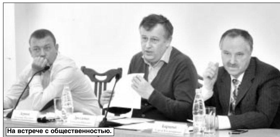
На встрече с общественностью.