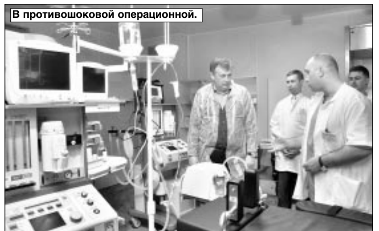
В противошоковой операционной.

окрестных населенных пунктов, то конкретного ответа на поставленный вопрос пока нет. Все упирается в технические проблемы, но губернатор пообещал, что без внимания этот вопрос не останется.