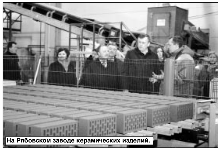
На Рябовском заводе керамических изделий.

После такой оценки и комментария председателя комитета по здравоохранению Арчила Лобжанидзе, который уточнил, что ремонт этих помещений и обеспечение их оборудованием обошелся областному бюджету в 15 миллионов рублей, Александр Дрозденко пришел к однозначному выводу: он признал, что Тосненская женская консультация теперь лучше в Ленинградской области.