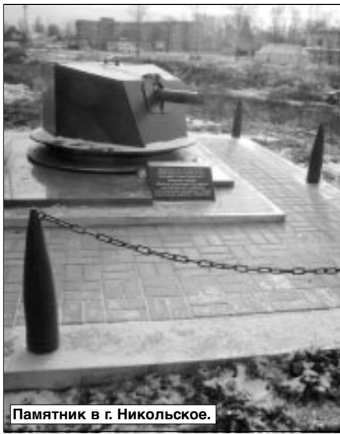
Памятник в г. Никольское.

подрядчиком за работы по благоустройству.