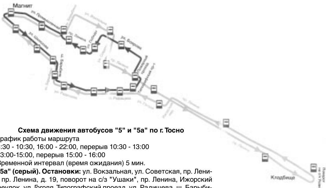
Схема движения автобусов "5" и "5а" по г. Тосно

Стоимость билета составит 20 рублей. Думаем, горожане и гости будут довольны такой транспортной услугой.