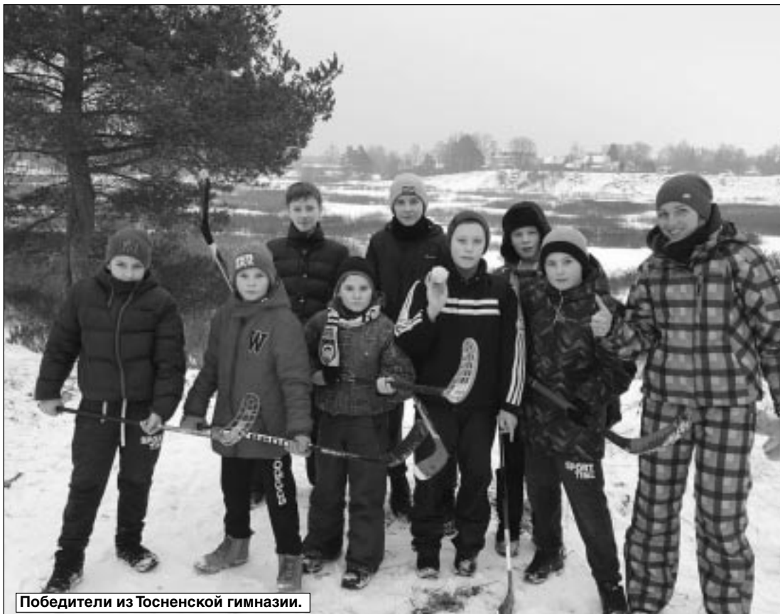
Победители из Тосненской гимназии.