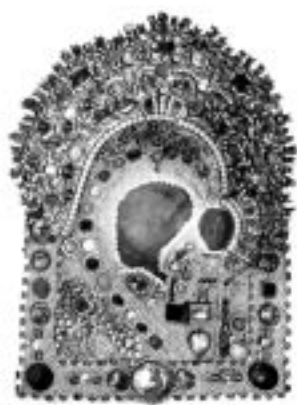
Чудотворная Казанская икона Божией Матери, хранящаяся в храме Воздвижения Креста Господня в г. Казань

народом. В Петербурге в честь Казанского образа построен грандиозный Казанский собор, хранящий в себе один из списков с первоначальной в Казани иконы Девы Марии, изображенной с Отроком Христом. Есть старинное пророчество: пока образ Казанской иконы Божией Матери будет находиться в Петербурге, враг в него не войдет.