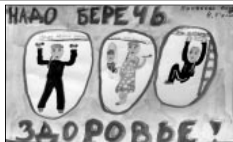
Материалы полосы подготовила С. Чистякова.

Принимайте препараты, укрепляющие иммунитет. Не употребляйте пряную и чересчур кислую пищу, не пейте апельсиновый сок, поскольку он только усиливают высыпания и боль.