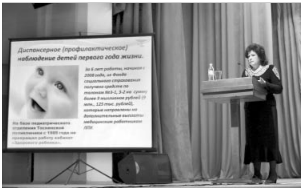
В 2014 году диспансеризация населения продолжена.