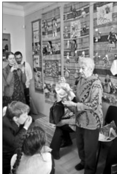
Тосненский историко-краеведческий музей приглашает всех посетить выставку "Мир дому твоему!", которая продлится до конца февраля.

Этот трогательный рассказ дает наглядное представление о мире детства ребенка военной поры.