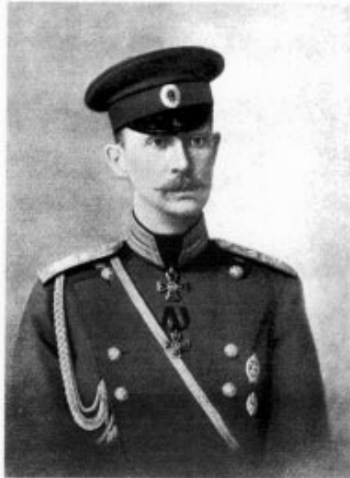
Великий князь Дмитрий Константинович