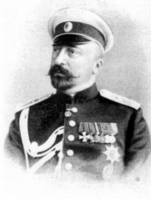
Великий князь Николай Михайлович