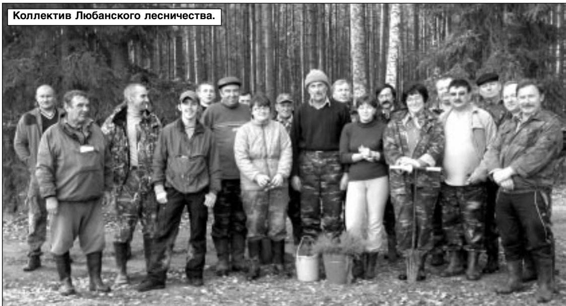
Коллектив Любанского лесничества.