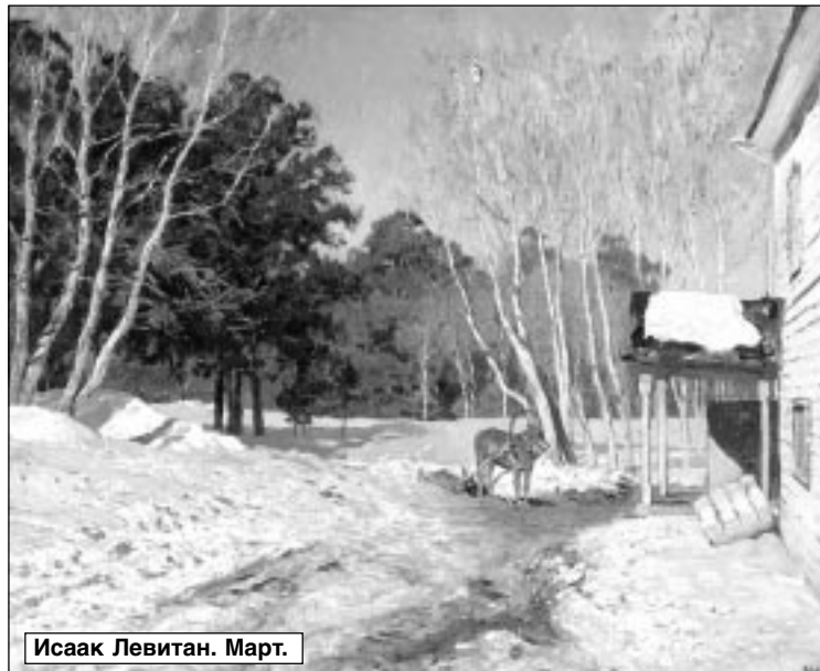
Исаак Левитан. Март.

Пахнут хризантемы вечерами, Мы в осеннем лоне красоты. И дарю тебе я со стихами Благодарно нежные цветы.